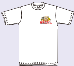
プリントサイズ 10×14cm内 プリント代 ¥630