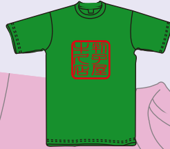
プリントサイズ 20×20cm内 プリント代 ¥1,260

+ウェア・Tシャツ代 (白色 735円、カラー 810円) (ヘビーウエイトTシャツ 5.6oz)