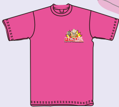
プリントサイズ 12×14cm内 プリント代 ¥1,300

*特殊なシートにデザインを印刷して、デザインに沿ってカッティングして熱圧着致します。周囲にフチが付きまします。