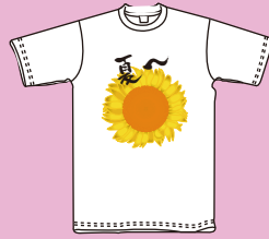
プリントサイズ 20×28cm内 プリント代 ¥1,100