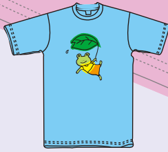
プリントサイズ 17×25cm内 プリント代 ¥1,600