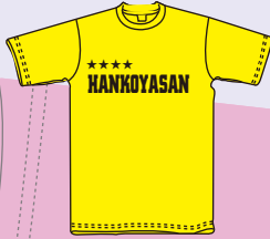
プリントサイズ 10×30cm内 プリント代 ¥840