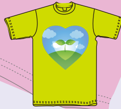
プリントサイズ 25×34cm内 プリント代 ¥2,000