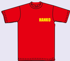
プリントサイズ 10×10cm内 プリント代 ¥630